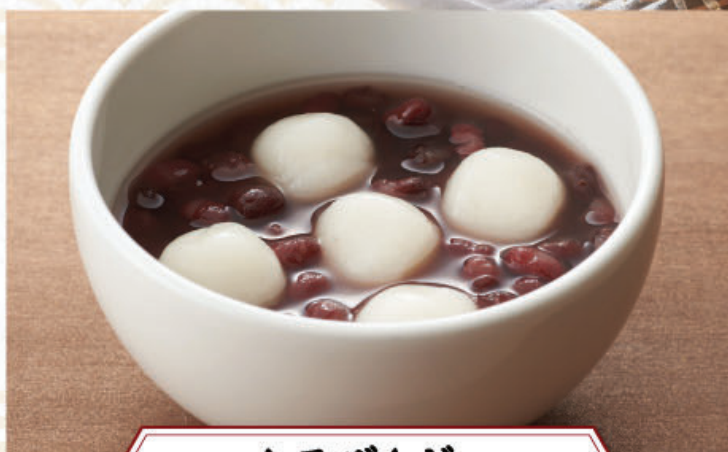
白玉ぜんざい 355円(税込390円)