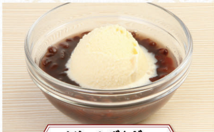
クリームぜんざい 355円(税込390円)