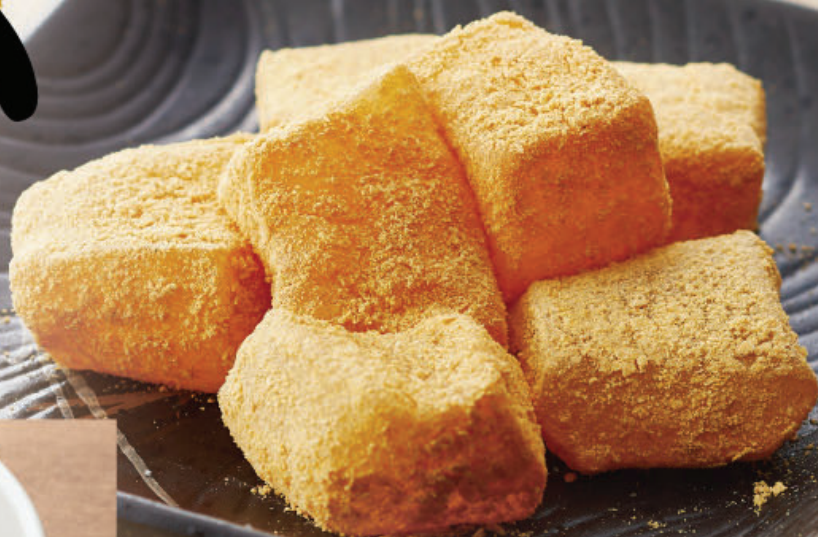
わらび餅 328円 (税込360円)