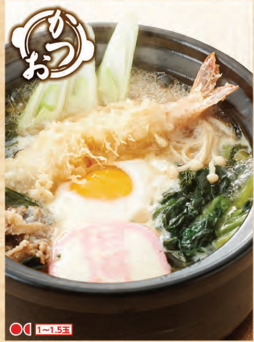
鍋焼きうどん 1,055円(税込1,160円)