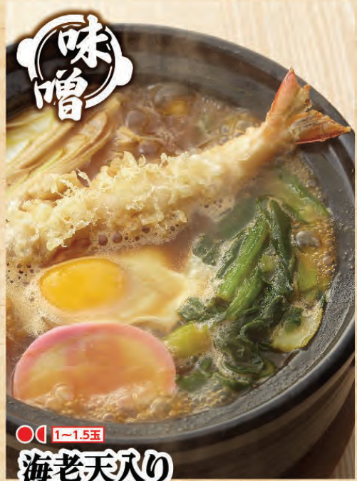
海老天入りの味噌煮込みうどん 1,055円(税込1,160円)